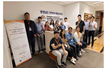
<수출상담회 및 현지 유관기관 방문 활동사진>